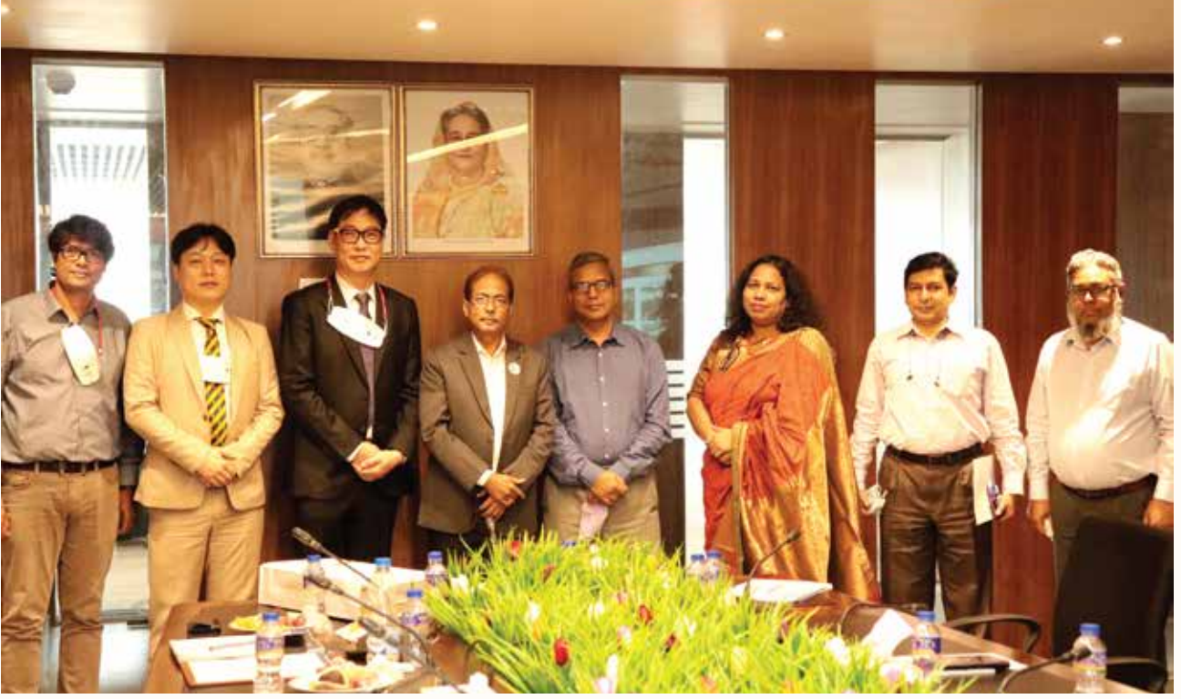
আইপিএসএন কোরিয়ার প্রতিনিধিদের সৌজন্য সাক্ষাৎ