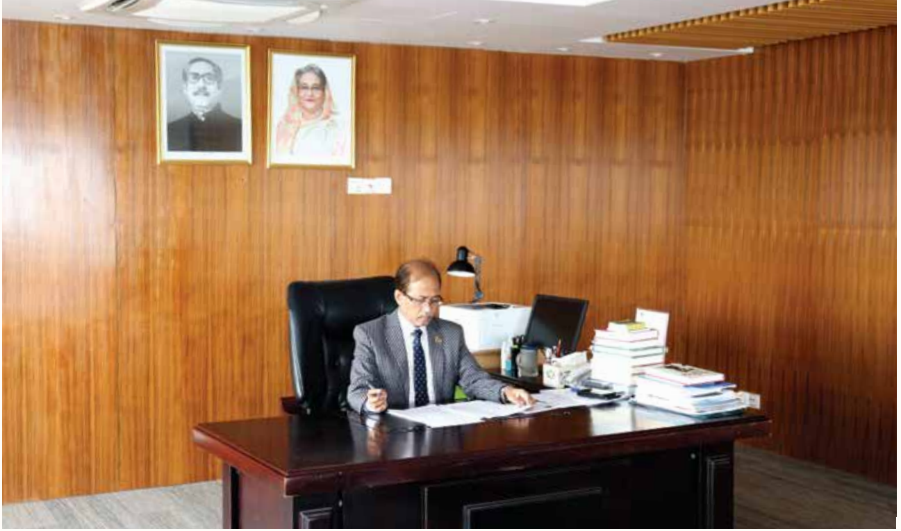
এনএসডিএ-এর নতুন অফিসে নির্বাহী চেয়ারম্যান (সচিব)-এর অফিস কক্ষ

জাতীয় দক্ষতা উন্নয়ন কর্তৃপক্ষের অফিস বাংলাদেশ বিনিয়োগ উন্নয়ন কর্তৃপক্ষ, আগারগাঁও-এ স্থানান্তরিত হওয়ায় নতুন অফিসের জন্য ফার্নিচার ক্রয়প্রক্রিয়া সম্পন্ন হয়েছে। এছাড়া, নতুন অফিসে এনএসডিএ-এর কর্মকর্তাদের জন্য কম্পিউটারসহ আনুষঙ্গিক যন্ত্রপাতি ক্রয় সমাপ্ত হয়েছে।