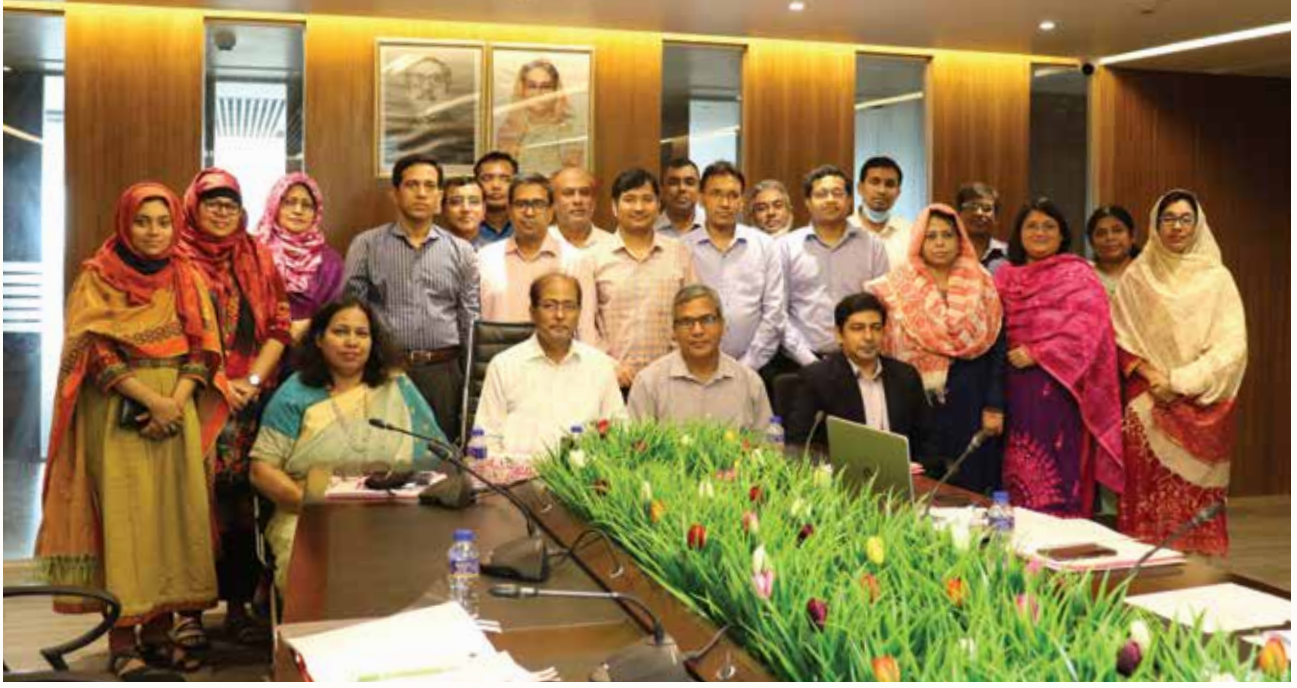
এনএসডিএ-এর নির্বাহী চেয়ারম্যান ও কর্মকর্তাবৃন্দ

২০২০-২০২১ অর্থ বছরে নিম্নবর্ণিত ৪৫টি সিএস ও সিএডি এবং ১১টি কারিকুলাম প্রণয়ন করা হয়: