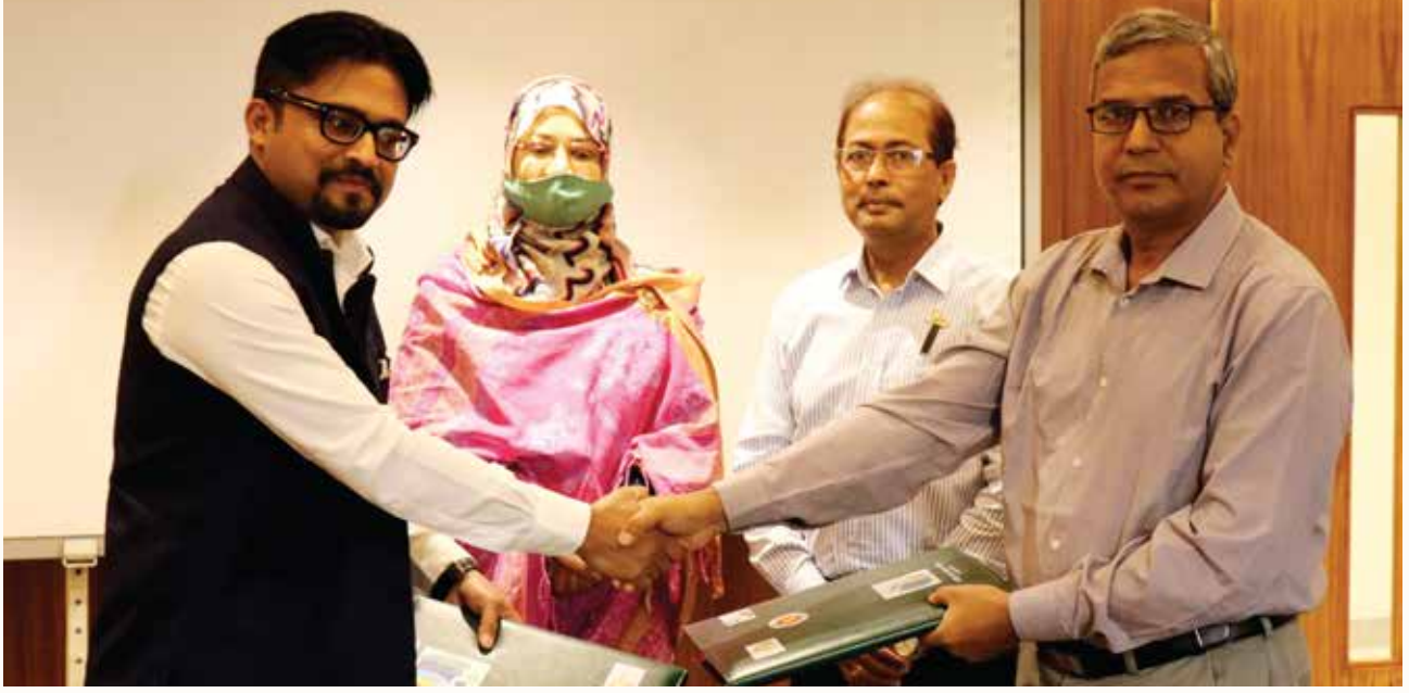
জাতীয় দক্ষতা পোর্টাল তৈরির জন্য পরামর্শক প্রতিষ্ঠান সিনেসিস আইটি লি.-এর সঙ্গে চুক্তি স্বাক্ষর

জাতীয় স্কিলসপোর্টালের ১৬টি মডিউলের চিত্র নিচে দেখানো হলো: