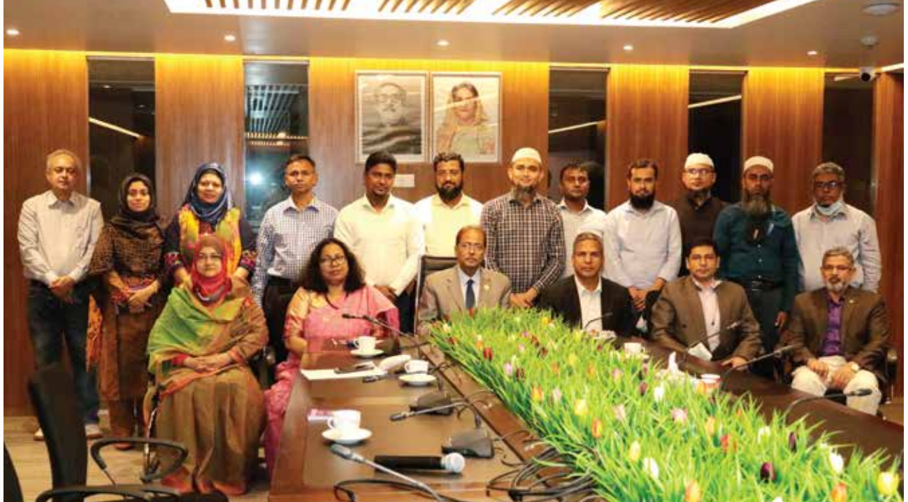
স্ট্যান্ডার্ড ভ্যালিডেশন কর্মশালা

করোনাকালীন ও করোনা-উত্তর দক্ষতা প্রশিক্ষণ প্রদানের জন্য কাজক্ষিত পরিবেশ তৈরি একটি চ্যালেঞ্জ হিসেবে দেখা যাচ্ছে। মহামারী পরবর্তী সময়ে পেশার পরিবর্তন ও বিপুল সংখ্যক কর্মহীন মানুষের জন্য দক্ষতা প্রশিক্ষণ প্রদান ও কর্মের সুযোগ সৃষ্টির বিষয়টি সামনের দিনগুলোতে নানাবিধ অনাকাঙ্ক্ষিত সংকটের সম্মুখীন হতে পারে। তাই মহামারী-উত্তর পরিবর্তিত সময়ে যুব দক্ষতার বিষয়টি পুনঃভাবনার দাবি রাখে। বিষয়গুলো বিবেচনায় রেখে এনএসডিএ বিভিন্ন পরিকল্পনা গ্রহণ করেছে।