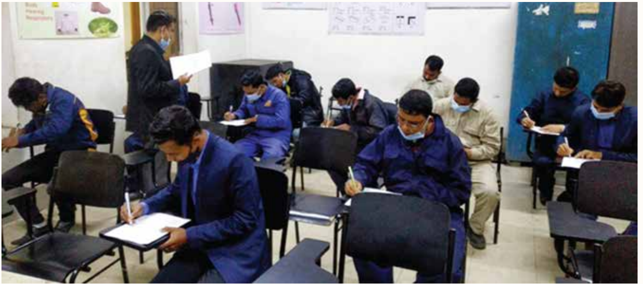
জাতীয় দক্ষতা উন্নয়ন কর্তৃপক্ষের অধীনে প্রশিক্ষার্থীদের অ্যাসেসমেন্ট