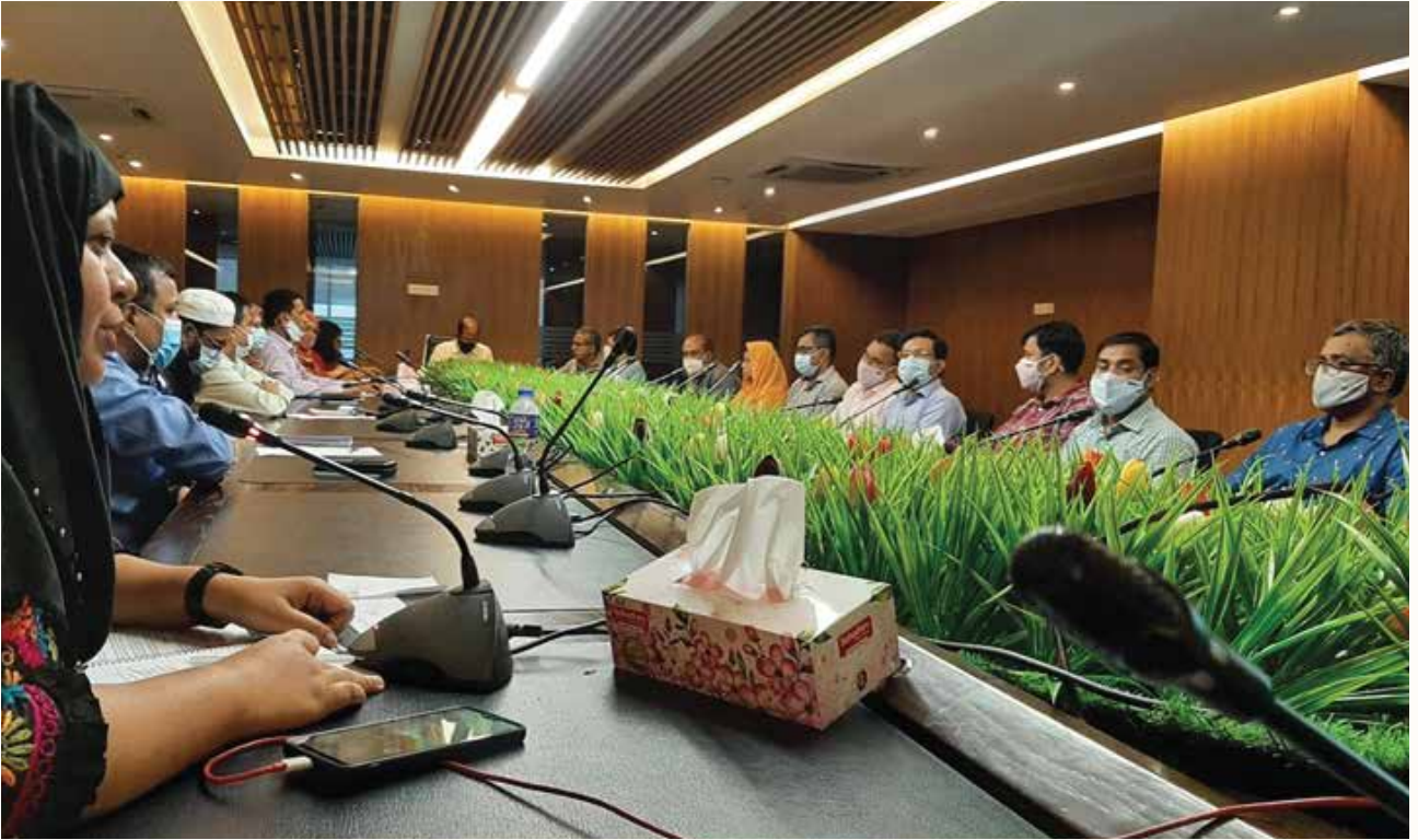
জাতীয় শোক দিবসে আলোচনা সভা