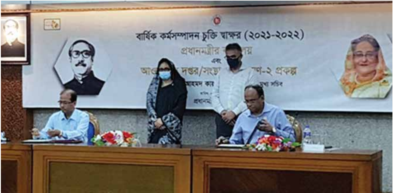
২০২১-২০২২ অর্থবছরের বার্ষিক কর্মসম্পাদন চুক্তি স্বাক্ষর

নির্বাহী চেয়ারম্যান, জাতীয় দক্ষতা উন্নয়ন কর্তৃপক্ষ এবং সচিব, প্রধানমন্ত্রীর কার্যালয়-এর মধ্যে ১ জুলাই ২০২১-৩০ জুন ২০২২ অর্থবছরের বার্ষিক কর্মসম্পাদন চুক্তি স্বাক্ষরিত হয়েছে।