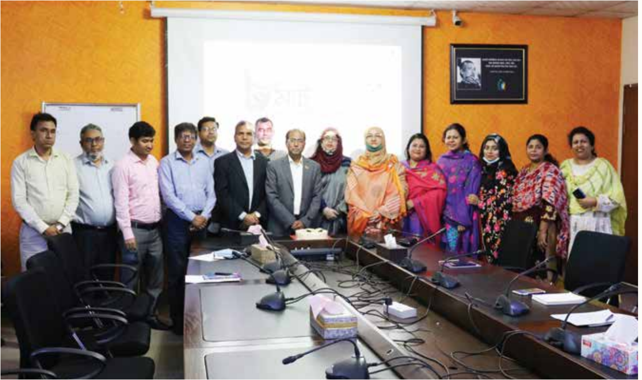
৮ মার্চ বিশ্ব নারী দিবস উদযাপন