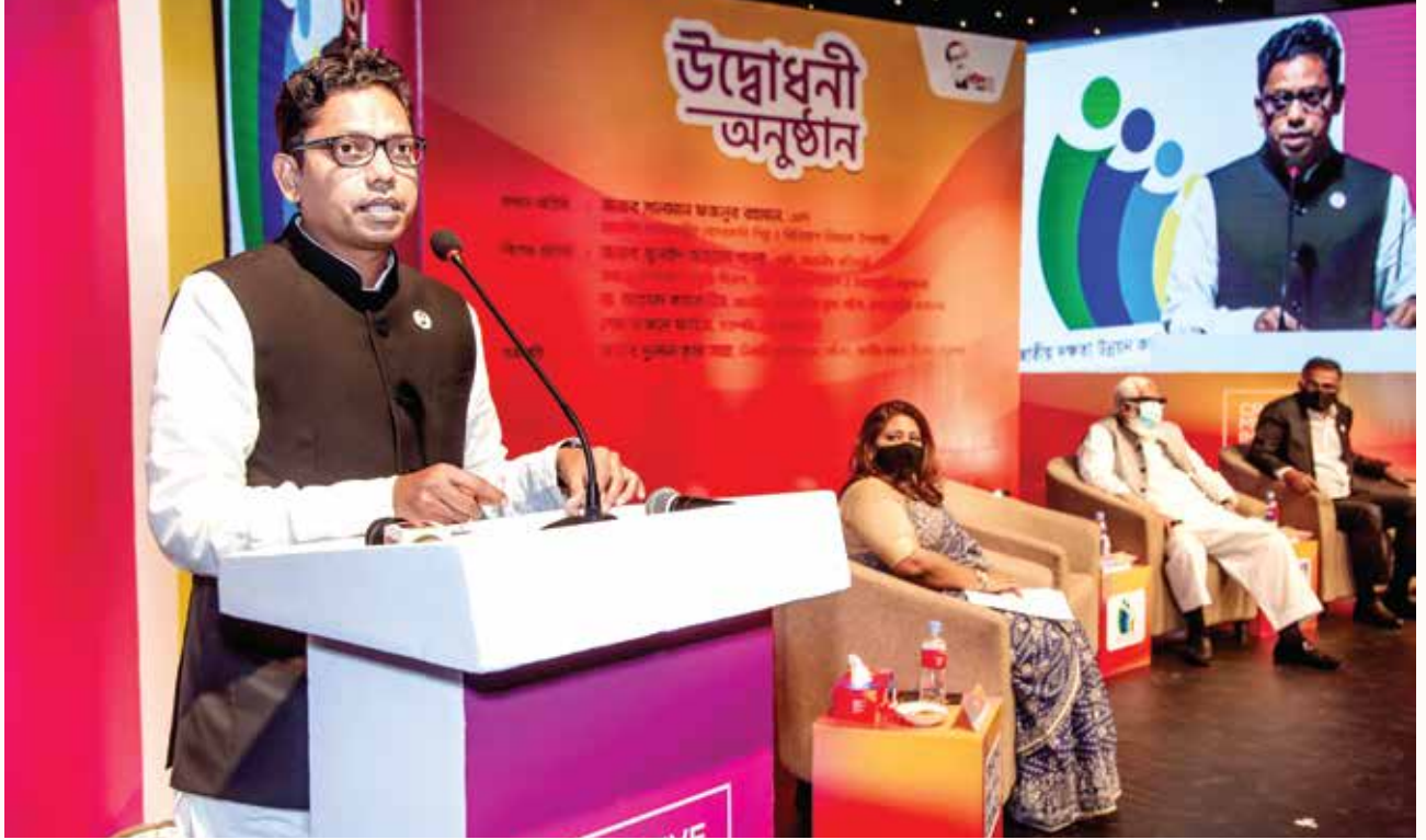
ক্রিয়েটিভ মিডিয়া আইএসসি-এর উদ্বোধনী অনুষ্ঠানে মাননীয় আইসিটি প্রতিমন্ত্রী জনাব জুনাইদ আহমেদ পলক, এমপি