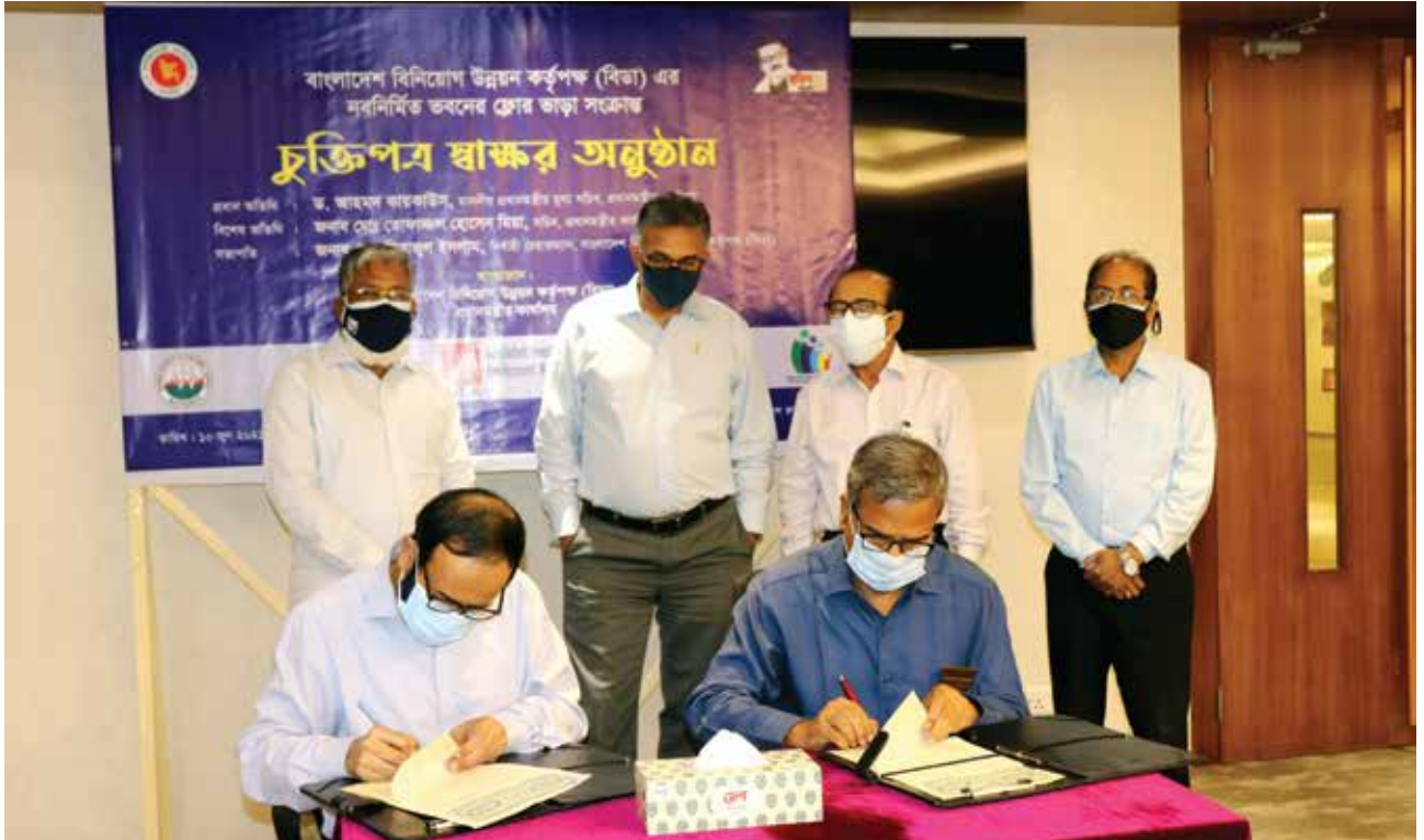
১০ জুন ২০২১ তারিখে বিডা ভবনে অফিস স্থানান্তর-সংক্রান্ত চুক্তি স্বাক্ষর অনুষ্ঠান

বাংলাদেশ ইনভেস্টমেন্ট ডেভেলপমেন্ট অথরিটি (বিডা) ভবন, আগারগাঁও, ঢাকায় এনএসডিএ-এর কার্যালয় স্থানান্তরের কার্যক্রম সম্পন্ন হয়েছে। জুলাই ২০২১ থেকে অফিসের কার্যক্রম বিনিয়োগ ভবন, ই-৬/বি, আগারগাঁও, শেরেবাংলা নগর, ঢাকা-১২০৭ এই ঠিকানায় পরিচালিত হচ্ছে।