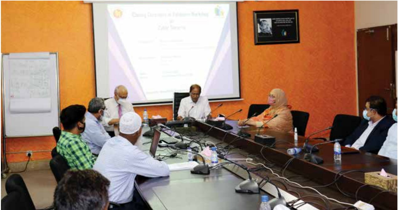
সাইবার সিকিউরিটি স্ট্যান্ডার্ড ভ্যালিডেশন কর্মশালার সমাপনী অনুষ্ঠান

ভেলিডেশন কর্মশালায় ভেলিডেশনকৃত সিএস ও সিএডি জাতীয় দক্ষতা উন্নয়ন কর্তৃপক্ষের সভায় অনুমোদন গ্রহণ করা হয়। কর্তৃপক্ষের সভার সিদ্ধান্ত অনুযায়ী অনুমোদিত সিএস/সিএডি ১৭ সদস্য বিশিষ্ট কর্তৃপক্ষের কার্যনির্বাহী কমিটির বোর্ড সভায় উপস্থাপনের জন্য প্রধানমন্ত্রীর কার্যালয়ে প্রেরণ করা হয় এবং সভার সিদ্ধান্ত অনুযায়ী তা অনুমোদিত হয়।