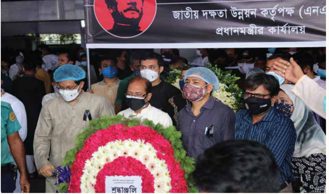
জাতীয় শোক দিবসে জাতির পিতা বঙ্গবন্ধু শেখ মুজিবুর রহমান ও ১৫ই আগস্টের সকল শহীদের প্রতি প্রতিকৃতিতে শ্রদ্ধাঞ্জলি