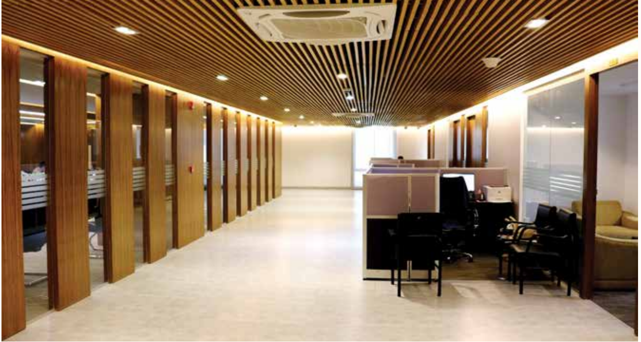
এনএসডিএ-এর নতুন অফিসের একাংশ

জাতীয় দক্ষতা উন্নয়ন কর্তৃপক্ষের অফিস বাংলাদেশ বিনিয়োগ উন্নয়ন কর্তৃপক্ষ, আগারগাঁও-এ স্থানান্তরিত হওয়ায় নতুন অফিসের জন্য ফার্নিচার ক্রয়প্রক্রিয়া সম্পন্ন হয়েছে। এছাড়া, নতুন অফিসে এনএসডিএ-এর কর্মকর্তাদের জন্য কম্পিউটারসহ আনুষঙ্গিক যন্ত্রপাতি ক্রয় সমাপ্ত হয়েছে।