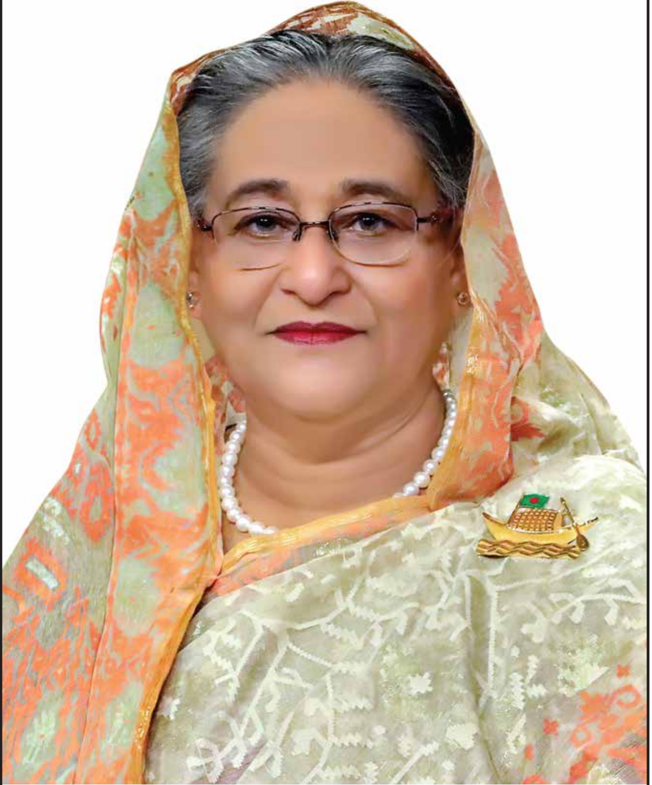
গণপ্রজাতন্ত্রী বাংলাদেশ সরকারের মাননীয় প্রধানমন্ত্রী শেখ হাসিনা