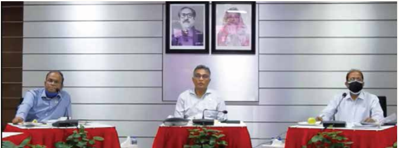
অ্যাকশন প্ল্যান ভেলিডেশন কর্মশালা

খসড়া দক্ষতা উন্নয়ন নীতি, ২০২১-এর ওপর ভিত্তি করে দক্ষতা উন্নয়ন অ্যাকশন প্ল্যান, ২০২০-২৫-এর প্রণয়নের কাজ চলমান আছে। দক্ষতা উন্নয়ন অ্যাকশন প্ল্যান প্রণয়নের জন্য আইএলও-এর সহায়তায় পরামর্শক প্রতিষ্ঠান প্রাইস ওয়াটার হাউস কুপারস (পিডব্লিউসি)কে নিয়োগ প্রদান করা হয়েছে। সংশ্লিষ্ট অংশীজনদের নিয়ে পর্যালোচনা ও কর্মশালার মাধ্যমে ইতোমধ্যে অ্যাকশন প্লান চূড়ান্ত করা হয়। অ্যাকশন প্লান বা কর্মপরিকল্পনাটি কার্যনির্বাহী কমিটিতে অনুমোদিত হয়েছে।