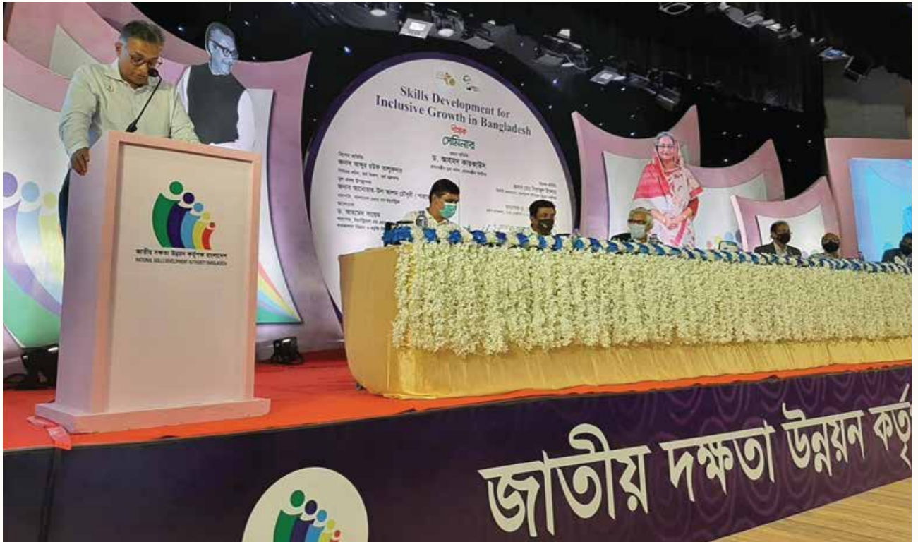
“স্কিলস ডেভেলপমেন্ট ফর ইনক্লুসিভ গ্রোথ ইন বাংলাদেশ” বিষয়ক সেমিনার