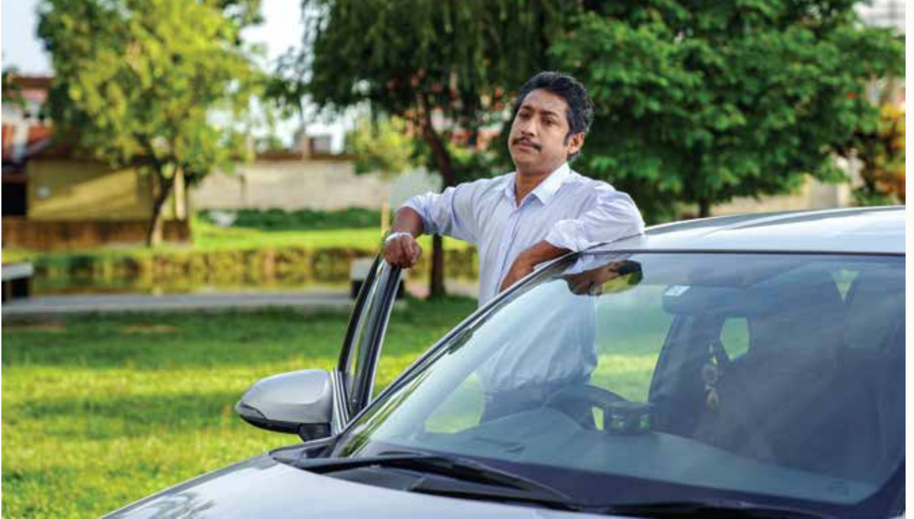
দক্ষতা বিষয়ে সচেতনতা বৃদ্ধির জন্য নির্মিত টিভিসি