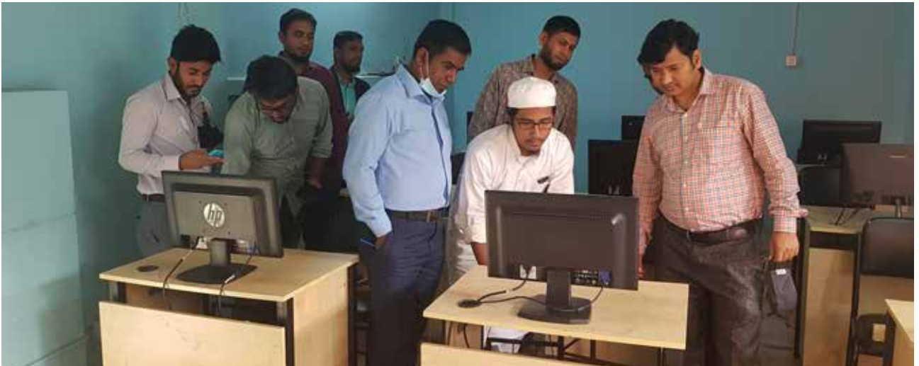
দক্ষতা প্রশিক্ষণ প্রতিষ্ঠান সরেজমিন পরিদর্শন করছেন এনএসডিএ ও আইএসসি-এর কর্মকর্তাগণ