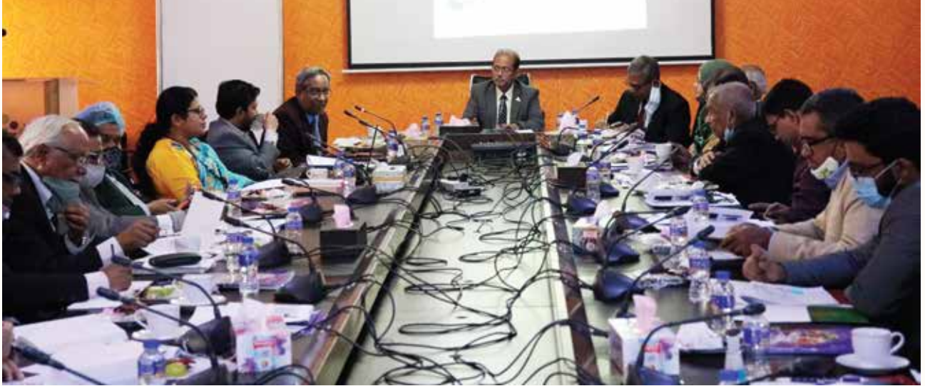
চতুর্থ শিল্পবিপ্লব বিষয়ে অবহিতকরণ সভা

শিল্প সংযুক্তি ও শিক্ষানবিশি ব্যবস্থা দক্ষতা উন্নয়নে একটি কার্যকর পদ্ধতি। আমাদের দেশে শিক্ষিত বেকারের সংখ্যা দিন-দিন বৃদ্ধি পাচ্ছে বিধায় শিক্ষানবিশি ব্যবস্থার মাধ্যমে দক্ষতা উন্নয়নের বিষয় বিবেচনা করা হচ্ছে। জাতীয় দক্ষতা উন্নয়ন নীতি ও জাতীয় দক্ষতা উন্নয়ন কর্তৃপক্ষ বিধিমালায় শিক্ষানবিশি ব্যবস্থার গুরুত্ব তুলে ধরা হয়েছে। এছাড়া জাতীয় মানবসম্পদ উন্নয়ন তহবিলে শিক্ষানবিশি কার্যক্রমে অর্থায়নের ব্যবস্থা রাখা হয়েছে। শিক্ষানবিশি গাইডলাইন প্রণয়নের লক্ষ্যে একটি ড্রাফট গাইডলাইন তৈরির কাজ চলমান।