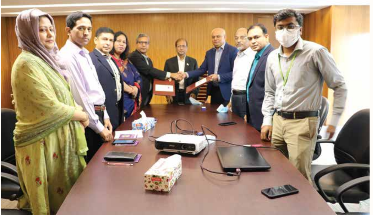
এনএসডিএ-এর নিয়োগসংক্রান্ত অনলাইন আবেদন প্রক্রিয়াকরণের জন্য টেলিটকের সঙ্গে সমঝোতা স্মারক স্বাক্ষর