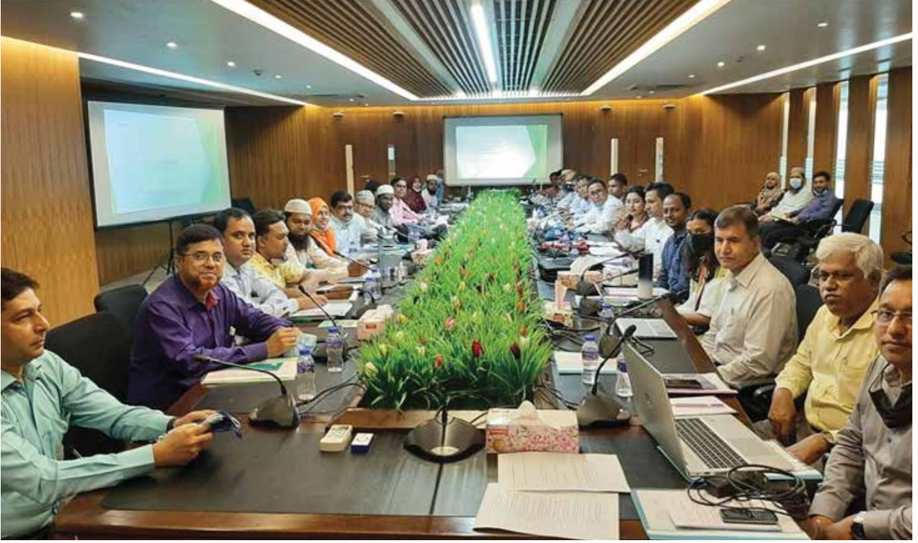
অ্যাকশন প্ল্যান, ২০২০-২৫-এর ইমপিমেটেশন প্ল্যান তৈরির কর্মশালা