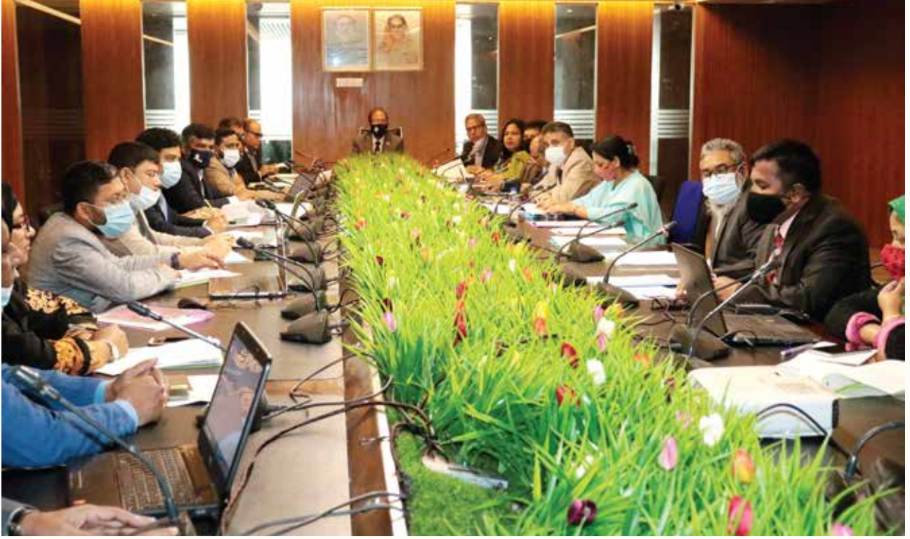
স্ট্যান্ডার্ড ভেলিডেশন কর্মশালা