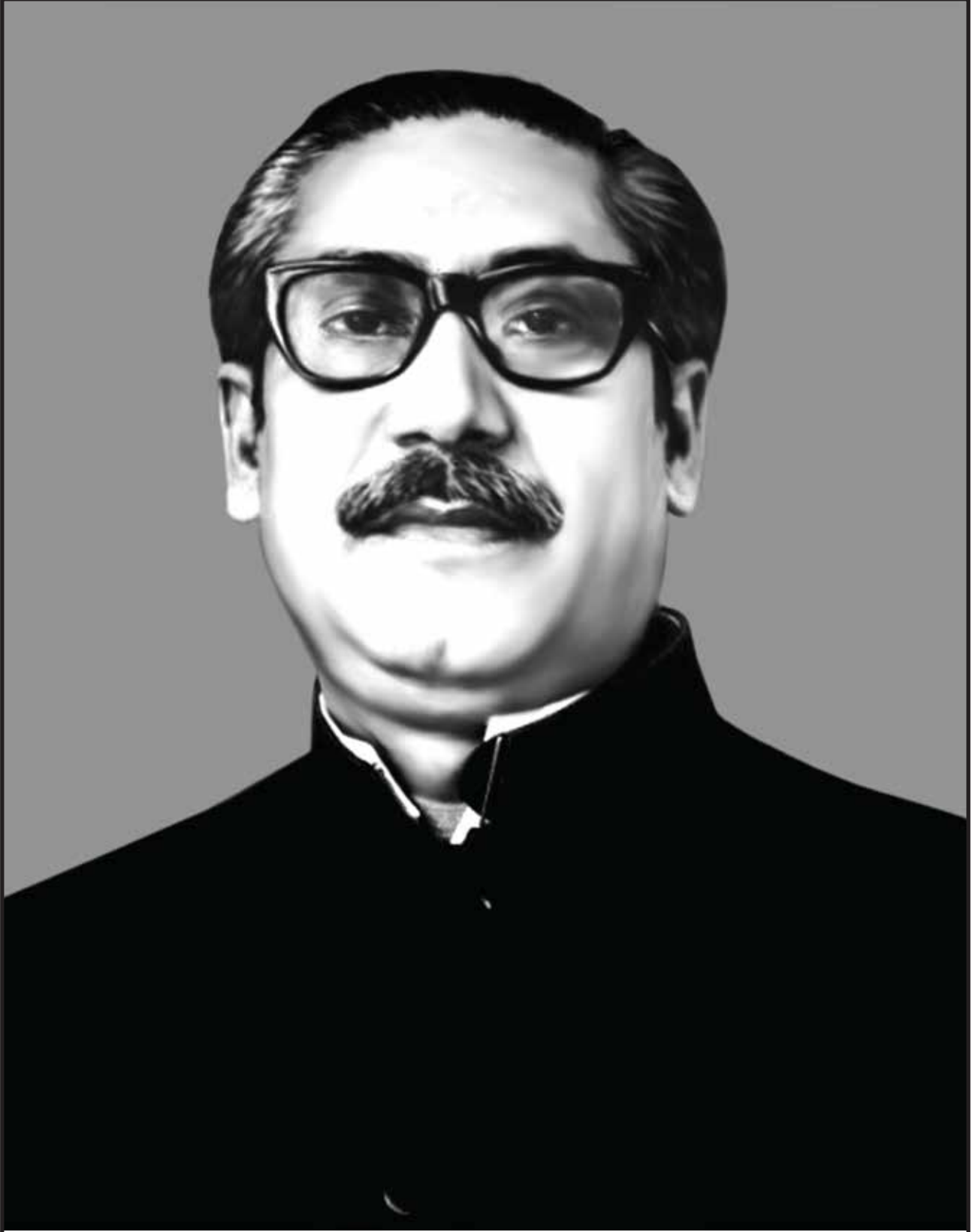
জাতির পিতা বঙ্গবন্ধু শেখ মুজিবুর রহমান