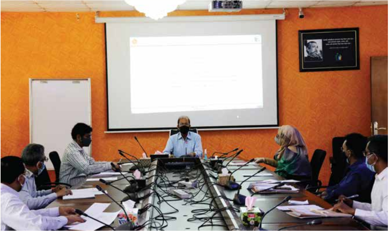
বার্ষিক কর্মসম্পাদন চুক্তি, ২০২১-২২-এর অগ্রগতি পর্যালোচনা সভা