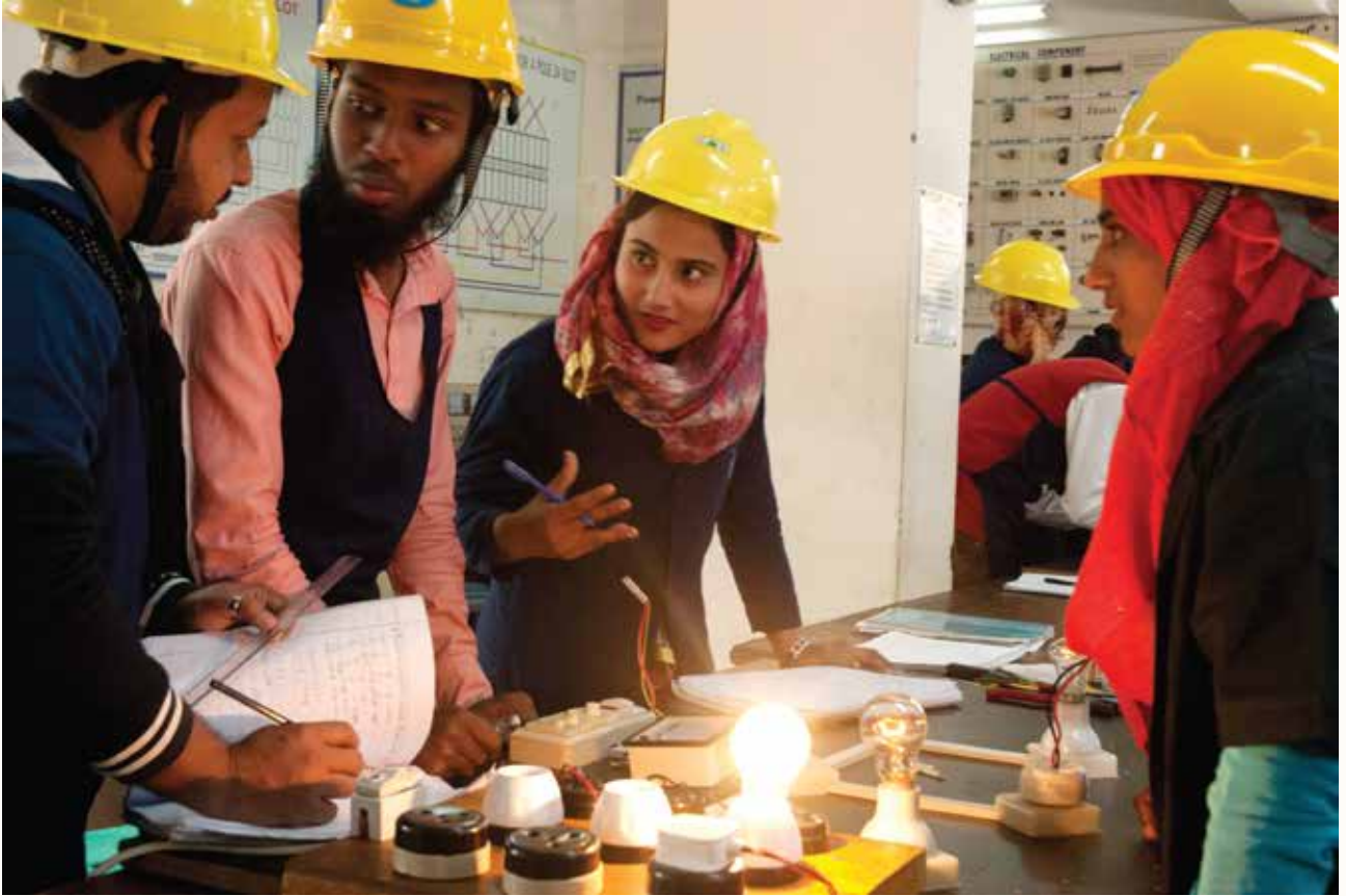
দক্ষতা প্রশিক্ষণ প্রতিষ্ঠানে প্রশিক্ষণরত প্রশিক্ষণার্থী