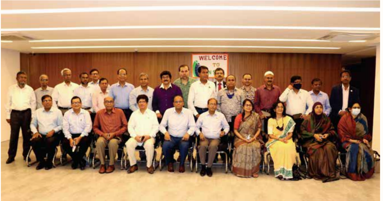
বিভিন্ন মন্ত্রণালয়/বিভাগের সচিব ও কর্মকর্তাদের সাথে এনএসডিএ-এর কর্মকর্তাবৃন্দ

সিবিটিএন্ডএ সম্পন্ন যে কোনো ব্যক্তি ও এনএসডিএ-এর পুলভুক্ত অ্যাসেসরদের মধ্যে সিবিটিএন্ডএ সম্পন্ন যে কেউ ট্রেইনার হিসেবে কাজ করতে আগ্রহী হলে তাদের ট্রেইনার অ্যাসেসর হিসেবে পুলভুক্ত করা হয়। এ লক্ষ্যে এনএসডিএ-এর নির্ধারিত পরীক্ষার মাধ্যমে কম্পিটেন্ট হলে ট্রেইনার অ্যাসেসরের পুলভুক্ত হওয়া যায়। এ পর্যন্ত ৬৯ জনকে ট্রেইনার অ্যাসেসরের পুলভুক্ত করা হয়েছে।