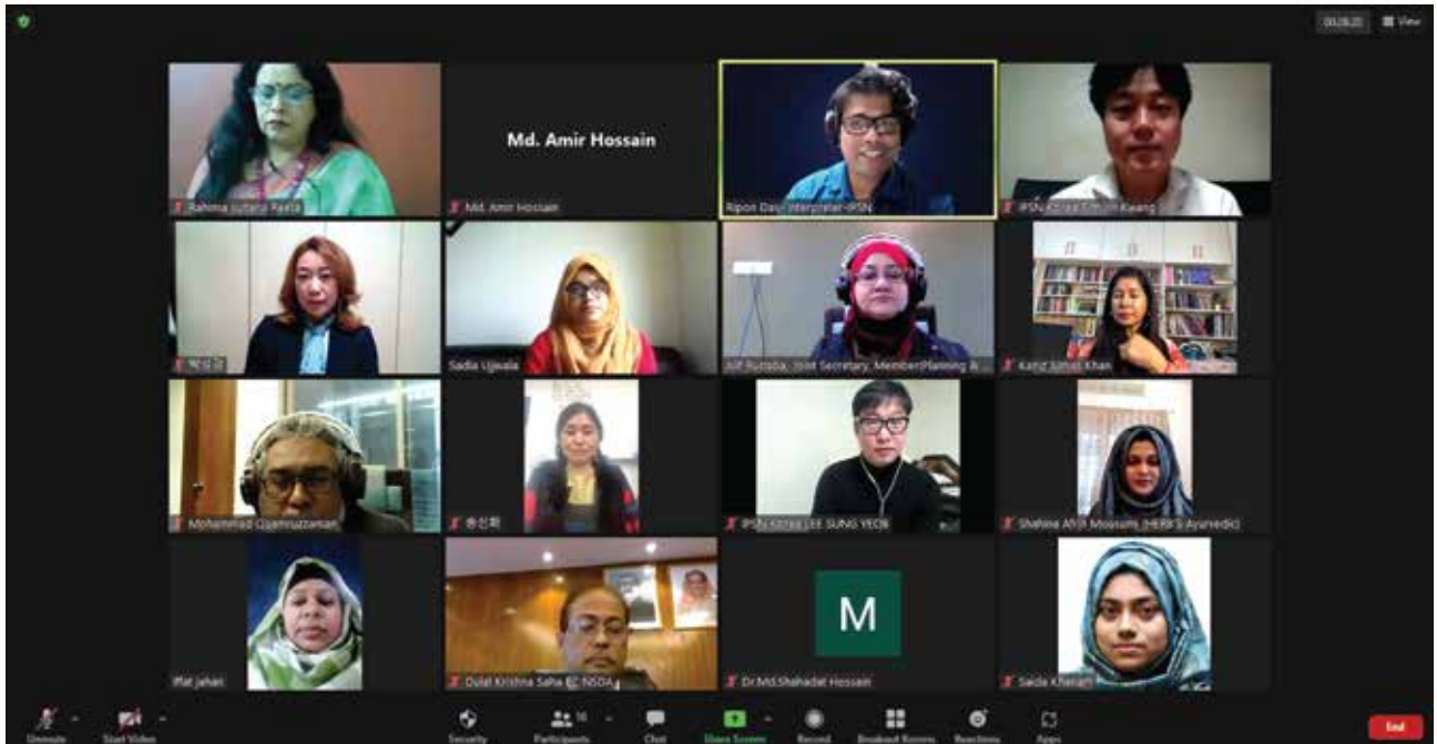
স্কিন অ্যাসথেটিক অকুপেশনের স্ট্যান্ডার্ড প্রণয়ন কর্মশালা

সক্ষমতাভিত্তিক প্রশিক্ষণ ও মূল্যায়ন পাঠ্যক্রম প্রস্তুত করতে কর্তৃপক্ষকে সহযোগিতা প্রদান করবে।