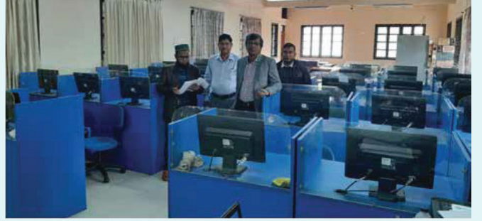
দক্ষতা প্রশিক্ষণ প্রদানকারী প্রতিষ্ঠান পরিদর্শন

এনএসডিএ-এর অধীনে নিবন্ধিত দক্ষতা প্রশিক্ষণ প্রতিষ্ঠানগুলো তাদের সক্ষমতার নিরিখে কোর্স পরিচালনার আবেদন করলে এনএসডিএ ও আইএসসি-এর কর্মকর্তাগণ প্রতিষ্ঠানটি সরেজমিন পরিদর্শনপূর্বক কোর্স প্রদানের সুপারিশসহ প্রতিবেদন দাখিল করলে কোর্স এক্রিডিটেশন প্রদান করা হয়। এ পর্যন্ত কোর্স অ্যাক্রিডিটেশনপ্রাপ্ত প্রতিষ্ঠানের সংখ্যা ১৩৫টি।