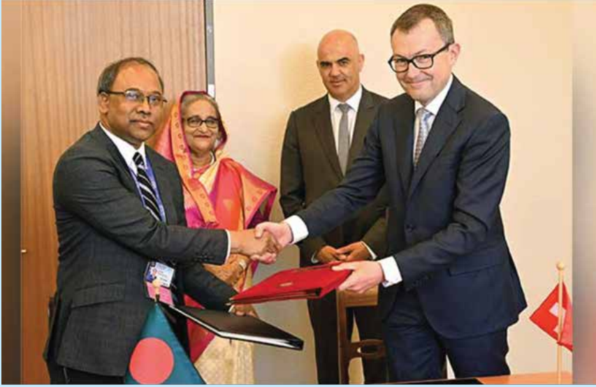
চুক্তি স্বাক্ষর অনুষ্ঠানে সুইস কনফেডারেশনের প্রেসিডেন্ট অ্যালেন বেরেস্ট ও বাংলাদেশের মাননীয় প্রধানমন্ত্রী শেখ হাসিনা

বাংলাদেশে দক্ষতা প্রশিক্ষণের সক্ষমতা বৃদ্ধির লক্ষ্যে বাংলাদেশ ও সুইজারল্যান্ড একটি সমঝোতা স্মারক (এমওইউ) স্বাক্ষর করেছে যা বিশেষ করে মেডিকেল ও আইটি সেক্টর থেকে সুইজারল্যান্ডে দক্ষ কর্মী রপ্তানির সুযোগ বাড়াবে।