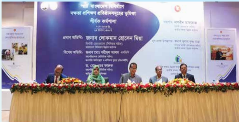
স্মার্ট বাংলাদেশ বিনির্মাণে দক্ষতা প্রশিক্ষণ প্রতিষ্ঠানসমূহের ভূমিকা শীর্ষক কর্মশালা

৭ মে ২০২৩ বাংলাদেশ বিনিয়োগ উন্নয়ন কর্তৃপক্ষ অডিটরিয়ামে জাতীয় দক্ষতা উন্নয়ন কর্তৃপক্ষ শক্তিশালীকরণ প্রকল্পের আওতায় 'স্মার্ট বাংলাদেশ বিনির্মাণে দক্ষতা প্রশিক্ষণ প্রতিষ্ঠানসমূহের ভূমিকা' শীর্ষক কর্মশালার আয়োজন করা হয়।