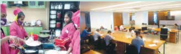
প্রশিক্ষণার্থী অ্যাসেসমেন্ট কার্যক্রম

অ্যাসেসমেন্ট কার্যক্রম পরিচালনার জন্য মানসম্মত অ্যাসেসমেন্ট টুলস প্রণয়ন করা একটি চ্যালেঞ্জিং কাজ। সমন্বয় ও অ্যাসেসমেন্ট অনুবিভাগ কম্পিটেন্সি স্ট্যান্ডার্ড অনুযায়ী শ্রমবাজারের চাহিদার ভিত্তিতে বিভিন্ন অকুপেশনের লেভেলভিত্তিক অ্যাসেসমেন্ট টুলস প্রণয়ন করে। কর্মশালার মাধ্যমে এনএসডিএ-এর পরামর্শকগণ এবং বিভিন্ন সেক্টরের এক্সপার্টগণ রিসোর্স পার্সন হিসেবে উপস্থিত থেকে লিখিত, ব্যবহারিক ও মৌলিক অভীক্ষার প্রশ্নপত্র, স্বমূল্যায়ন ডকুমেন্ট প্রণয়নসহ প্রশ্নব্যাংক অর্থাৎ অ্যাসেসমেন্ট টুলস তৈরির কাজ করেন। ইতোমধ্যে এনএসডিএ কর্তৃক ১০৪টি অ্যাসেসমেন্ট টুলস প্রণয়ন করা হয়েছে।